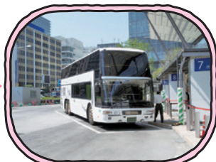
最寄りの駅より バスに乗る