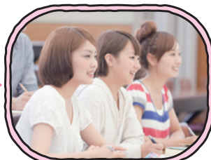
オープンキャンパス 参加