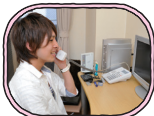
オープンキャンパス に予約