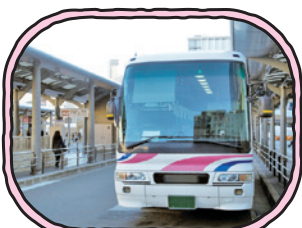
翌日帰りのバスに乗る