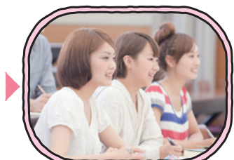
オープンキャンパス 参加